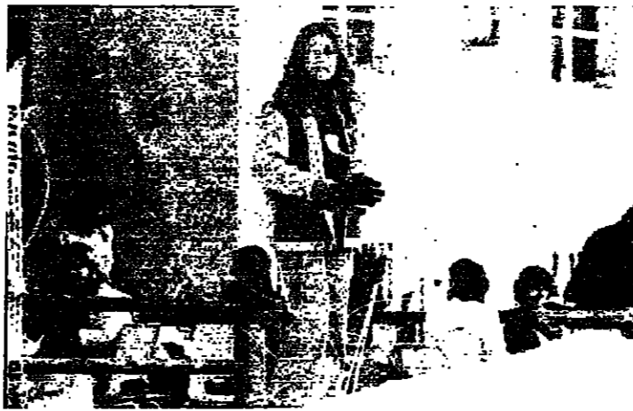
متزلجان في فترة استراحة في غاريا

كتب مروان عبدالله : بين فاريا وفترا توزع هواء الثلج امس بكثافة وفرح الاطفال الذين سثموا شوارعهم المختصرة ، والكبار الذين هجروا الى حيث لا مدينة ولا اختصار مسافات وأنسان . داليدا كانت تغني امس «اضحك فانت الملك» . عمروا التسابل تحت الشمس وكتبوا باصابعهم بعض قصص حب او رستوا الشجر العاري والمواصف التي لم تات امس الى مدينة الثلج . المهم انهم هناك يختصرون احزانهم ويحاولون الفرح ويستقرون بعض الغيم الطالع . وحده الانسان على حقيقته ، هندسة الاشكال تسقط ، ومن طبيعة آدم لم يبق الا هذا الشجر الذي يتراحى من بعيد ، وهذه الطرق التي تنسل بين كوم الثلج وتضع حيث تضع مخلقة وراءها بعض خطوط سوداء احلى ما فيها حياؤها المرتجل . « اضحك فانت الملك » . سكان الثلج امس بارسوا لعبة الملك وتذفوا بعضهم بكرات الثلج . المتخار يفتقون عندما تطال ذواتهم الكبار . على كل حال ، انها لعبة الملك ورقصوا حتى الفرح ، زرعوا صدر الجبل خطوطا متشابكة كالمسام ، قزلوا وطعموا مرات وجرات . حفروا لانفسهم ظللا تخاف القبة . المهم ان الحرب انتهت ، والسلام ات ولو على عربة يقودها طفل صغير وهم الان يعيشون فرح السلام ونعمة الثلج في وطن الثلج . القيم مر من تحت الجبل والمدينة في الفاع وهم على القبة . بينهم وبين المدينة والماضي تلال من الغيم . والاستراحة كانت في فندق « غاريا الزار » .